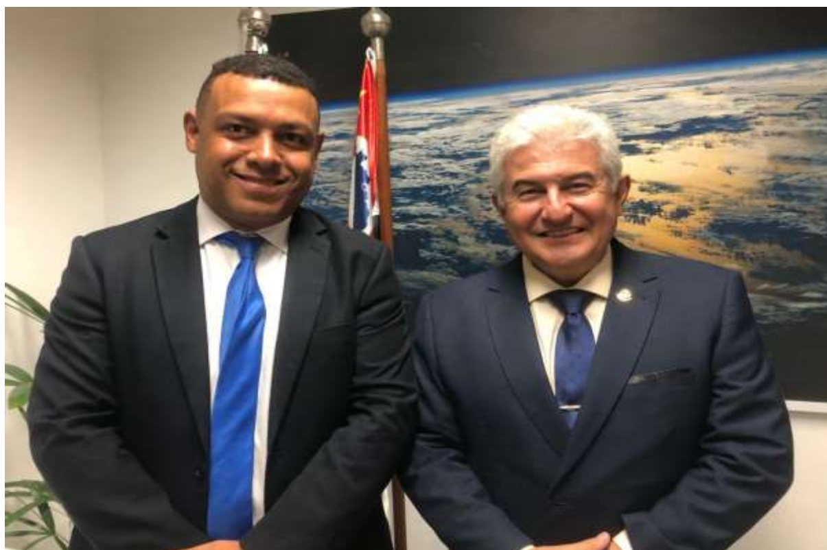
Foto 9 Reunião com o Senador da República Astronauta Marcos Pontes em seu gabinete parlamentar no Senado Federal